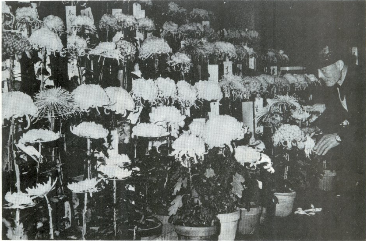
菊の香がいっぱい 晩香会主催の「菊花展」が、11月2、3の両日、市民文化会館ロビーで、市民総合文化祭の併催行事として開かれました。

市の人口 男 25,190人 世帯数 13,925 女 26,933人 (昭和51年11月1日現在) 住民基本台帳から