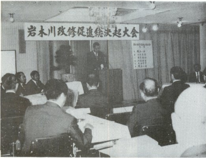
岩木川の改修促進を訴える大会