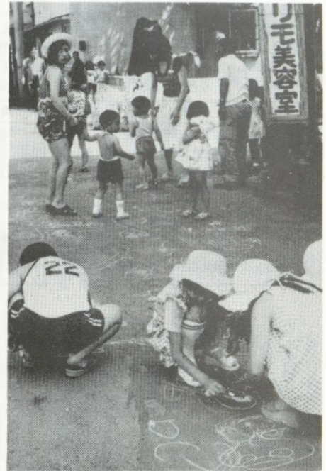
錦町のちびっ子道路で

夏の交通 安全運動の一貫として 市が開設している「ちびっ子道路」が、ことしもさる七月二十六日から市内の四カ所で開催し、夏休みに入った子供たちで終日にぎわっていました。