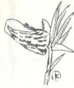
No. 1 ヒメホテイラン (ラン科)

市教育委員会主催の「市民弓道教室」が次のとおり開催されます。 弓具は道場に備え付けのものがあり、弓道会員が親切に指導いたしますので一般の方ならどなたでもお気軽においでください。 期間 五月十八日から十月三十日まで毎週火曜日と土曜日 時間 午後七時から九時 場所 三道会館弓道場 申込先 市中央公民館(電話 五二二三五二) 弓道会(電話 五二〇八三 成田方)