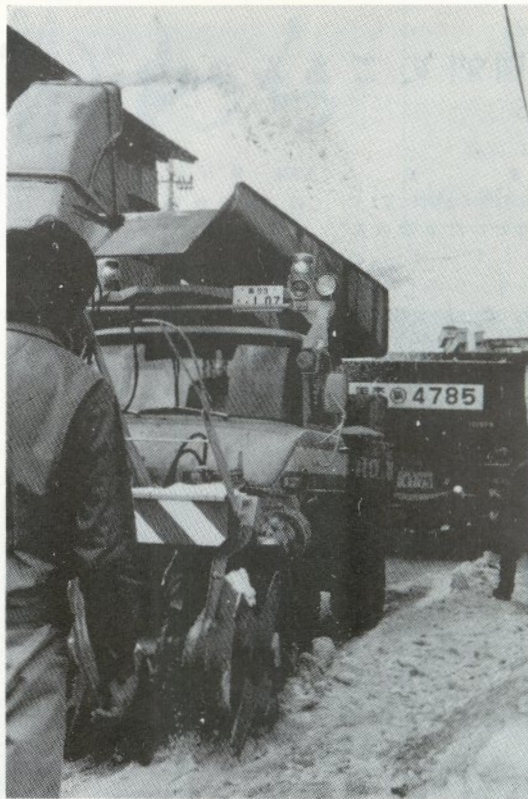
氷雪路盤もこなごな 最新の除雪機配備

最近はこの繰り上げ請求をする人が目立って多くなりました。しかし、この繰り上げ請求をすると、六十五歳から支給をうける場合を百とすれば、大幅に減額され、次のように少ない割り合いの年金しか受けられなくなり、六十歳以上、六十一歳未満で受ける場合 五八%、六十一歳以上、六十二歳未満で受ける場合 六五%、六十二歳以上、六十三歳未満で受ける場合 七二%、六十三歳以上、六十四歳未満で受ける場合 八〇%、六十四歳以上、六十五歳未満で受ける場合 八九%、この繰り上げ請求によつて減額された割り合いは、その人が六十五歳になつた後も生涯続きます。物価スライドなどで年金