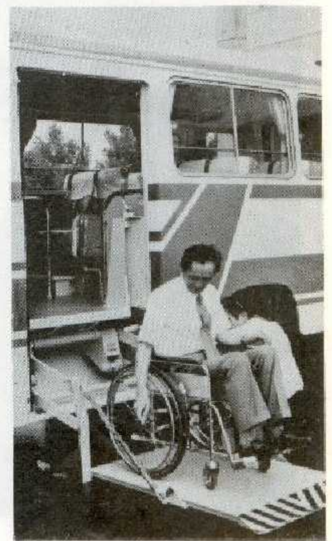
車イスでも乗れます

「あなたの意見を聞く集い」において、各地区から要望されていたもので、ここに実現したことをご報告いたします。