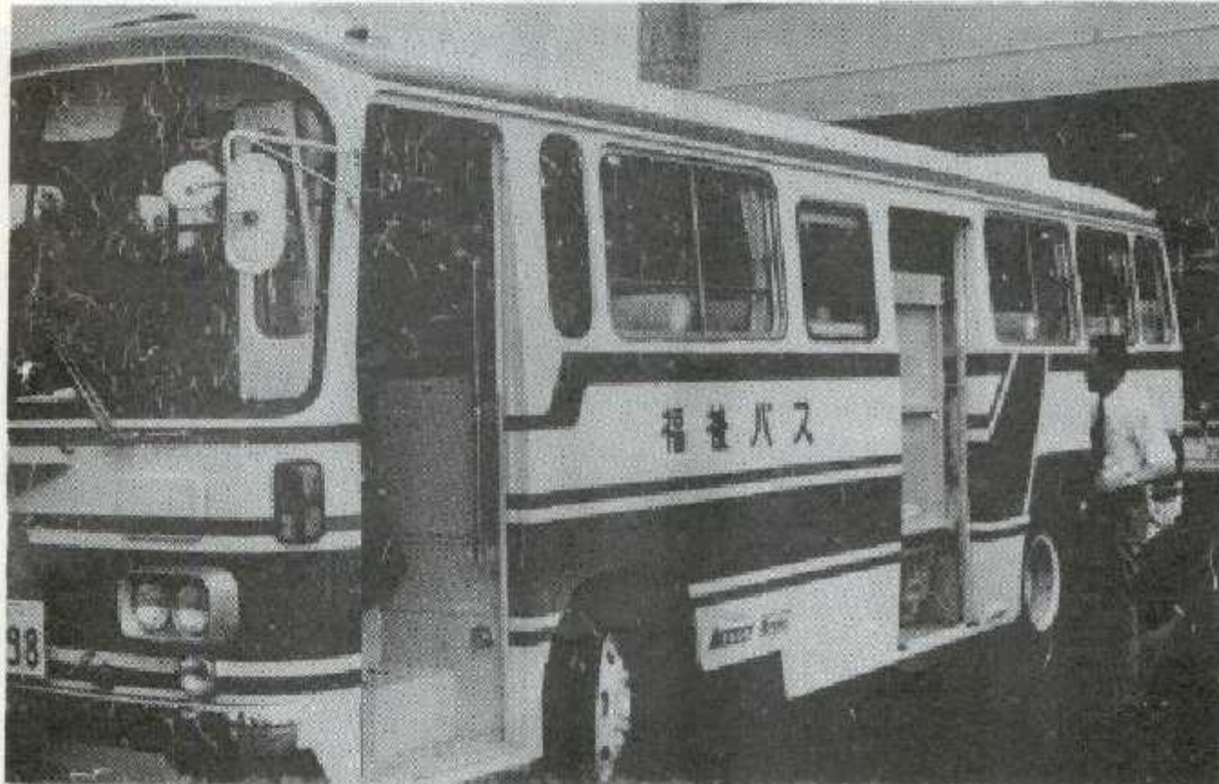
48人乗りの「福祉バス」