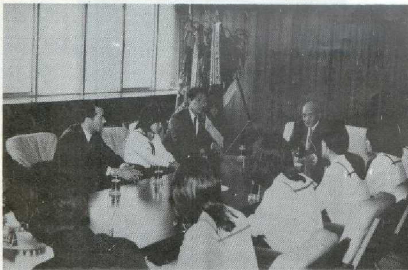
市庁舎を訪れた七和高の一行