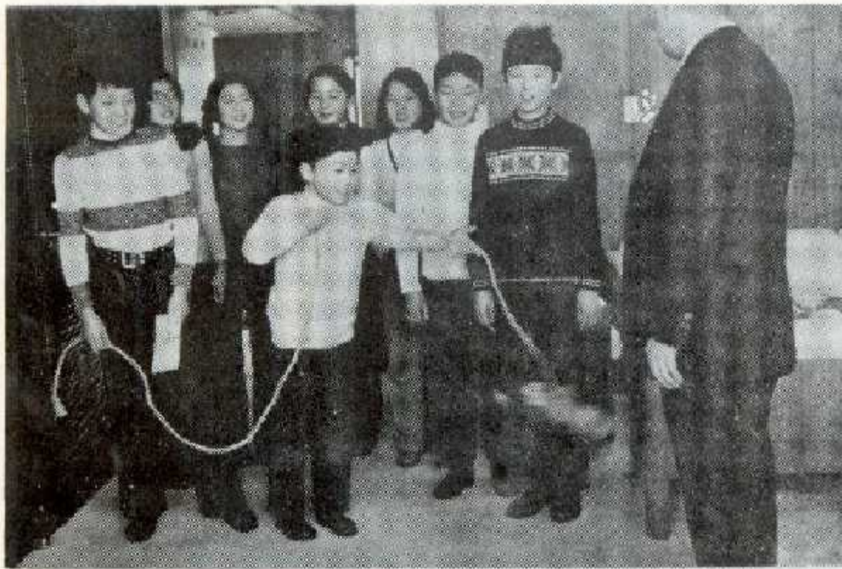
佐々木市長に福儀を披露する 梅田・中泉の子どもたち

なお、工事現場で働く人々が退職金をもらえるよう建設業退職金共済制度に加入するようにしてください。