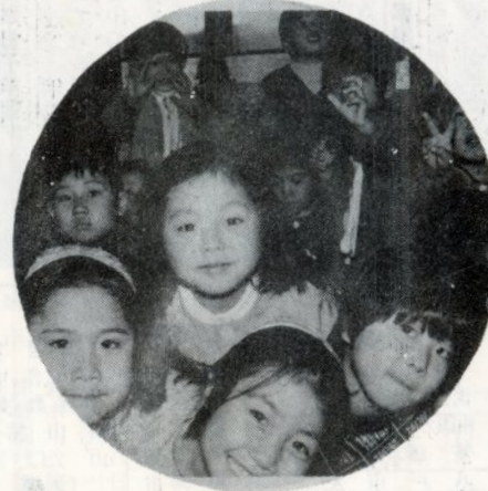
まつしま団地保育園で