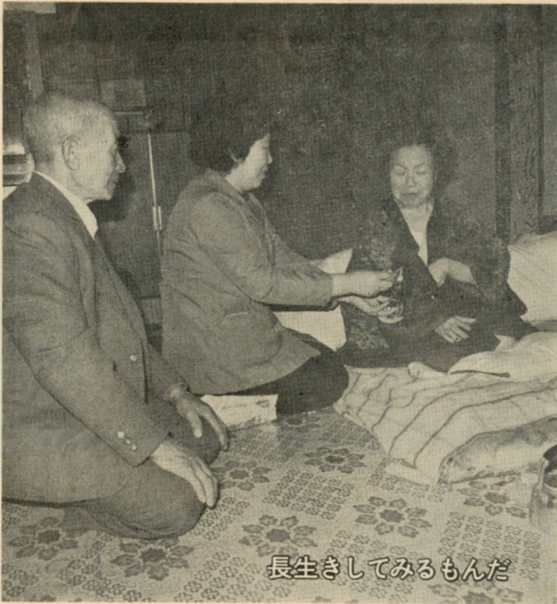
長生きしてみるもんだ

法人所有の非住宅地などは、評価額と四十八年度の負担調整の課税標準額との差額の三分の一を評価額か