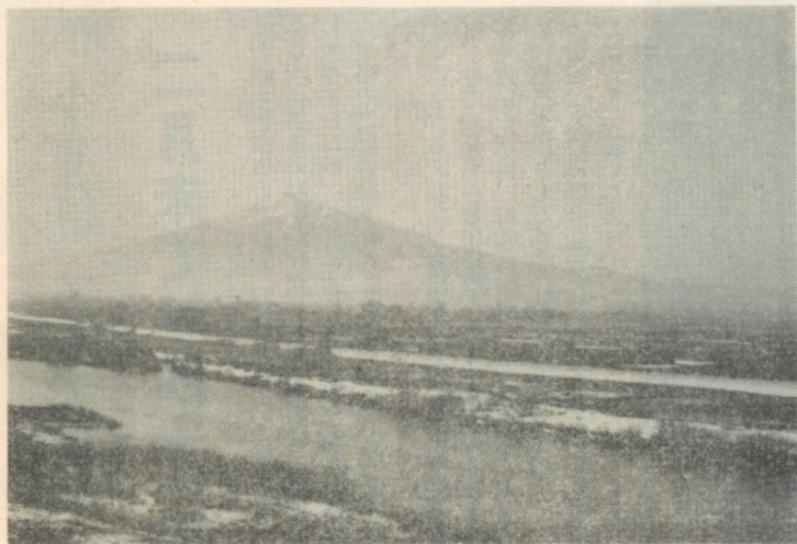
「河川公園」建設予定の岩木川原