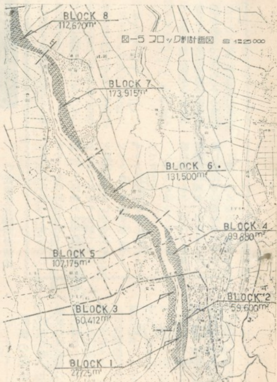
ブロック割計画図