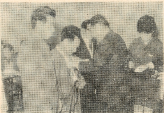
表彰を受ける生産者たち

四十七年度から税の事務がコンピュータ処理され納税通知書や督促状などのあて名がカタカナになったことはご承知かと思いますが、ところどころの読み方に誤りがあり、いろいろご指摘を受けておりますが、これを四十八年度