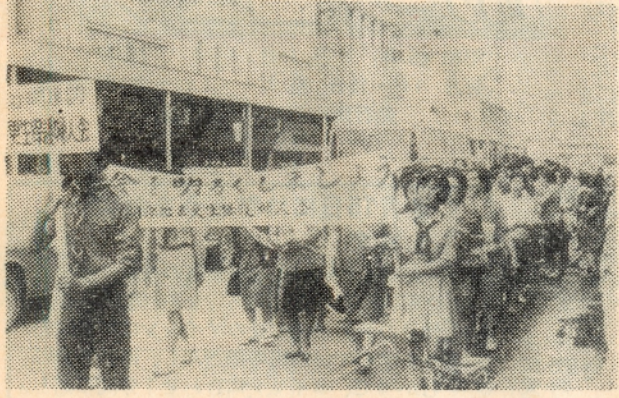
（子どもには、常に暖かい目をかけましょう）

ことは「青少年の非行防止と住民の参加」を重点目標に、七月十七日の土曜日十四時から、市内の、保護司会・更生保護婦人会・人権擁護委員協議会・社会福祉協議会・町内会連合会・防犯協会・青少年問題協議会・各学校・