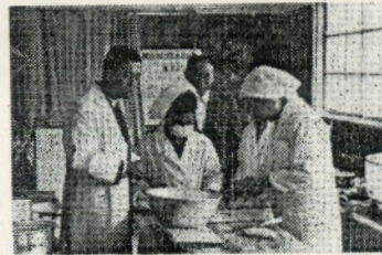
(共同炊事は特においしい)