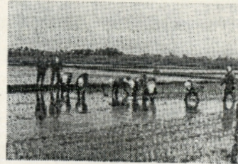
(順調に進む田植え)

助成して共同炊事施設をつくつていますが、カロリー栄養とすぐれたこん立の食事には苦しい田植えを楽しいものにしていきます。