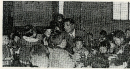
(水野尾季節保育所で)

一家が総出の田植えどきは例年子どもの事故が多く、若いお母さん方は、その心配で田植えする手もおくれがちです。この開設に地域の人は「安心して働ける」と大歓迎です。