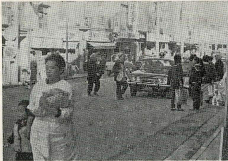
〔直前横断、左側通行は事故のもと〕