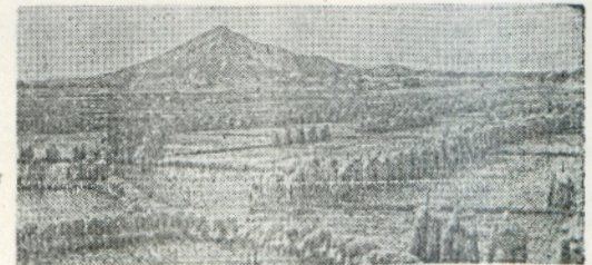
〔ひろびろと開ける津軽平野〕

それが現在の五所川原市の隆盛をうながしてきたものです。私どもはこの繁榮の蔭にひそむ、われわれの祖先の骨身を削つた労苦の果實を忘れてはならない。このことを深く脳裡に刻み、祖先の靈に厚く感謝しなければならぬと思う。(おわり)