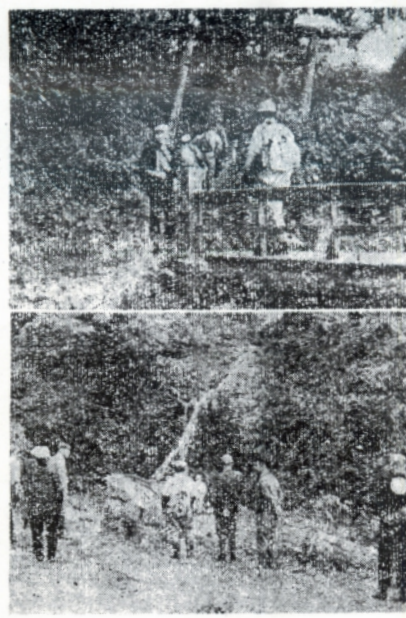
一行は市役所から自動車を出発、原子、岩野に根を結用し山頂野山...