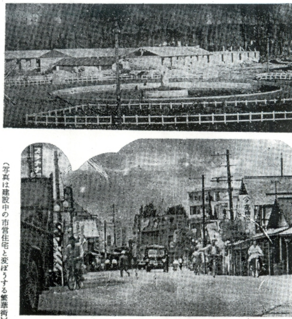
(写真は建設中の市営住宅と受ける繁華街)

博覧会を契機として五所川原のどしらを向いても新築の公営住宅が建てられ、市勢発展の力が見られる。強い歩みを示している。住宅不安が、一掃され、博覧会跡地を開放せよ。五所川原市の近代都市化といふ程で言つて、五所川原市は土地が広いので、博覧会跡地を開放せよ。三万坪といふ敷地は、五所川原市に土地がないので、博覧会跡地を開放せよ。三万坪といふ敷地は、五所川原市に土地がないので、博覧会跡地を開放せよ。三万坪といふ敷地は、五所川原市に土地がないので、博覧会跡地を開放せよ。