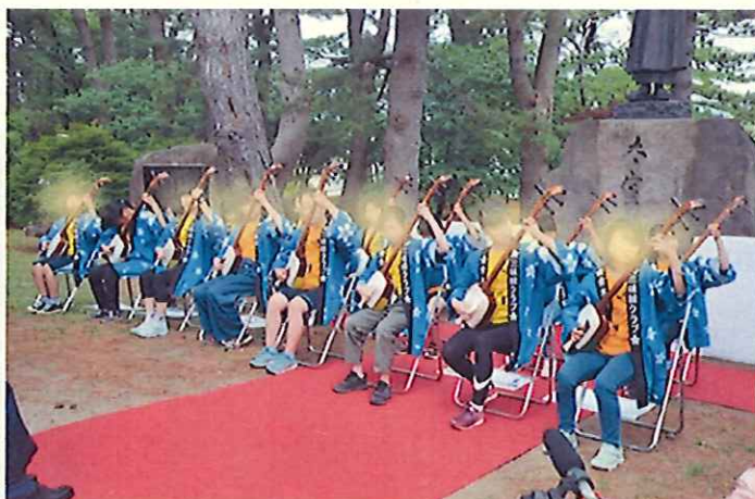
金木小学校 三味線クラブ

(2) 市民文化祭の開催支援のほか、民俗芸能イベントの情報提供など、郷土芸能を発表する機会の提供に努めます。