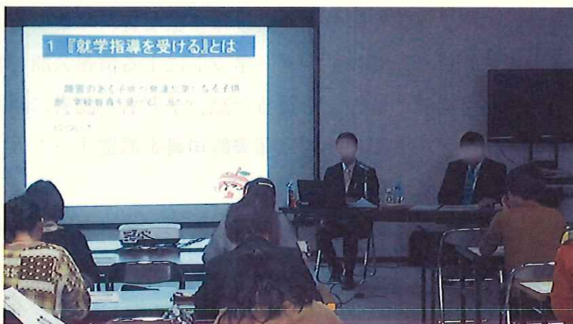
ハートネットを作ろう！ちょっと気になる子への支援

②教育委員会と市内小中学校が連携し、家庭教育に関する相談の受付や地域社会との関わりが希薄な家庭への訪問等を行うなど、個々の家庭が主体となった家庭教育を推進するための支援を図ります。