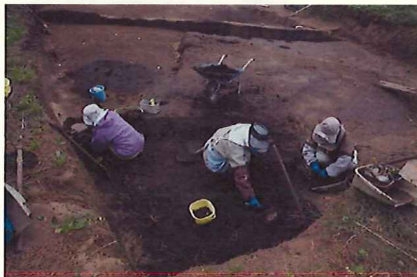
五月女菴遺跡発掘調査

(1) 国指定重要文化財の「旧平山家住宅」、太宰治の生家である「旧津島家住宅（太宰治記念館「斜陽館）」など、貴重な文化財を後世へ繋げるために更なる調査、保護に努めます。