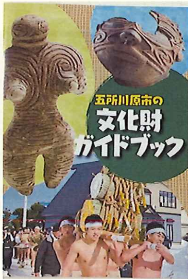
文化財ガイドブック