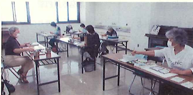
みんなの教室（中央公民館）

①市民の学習ニーズを把握しながら公民館の各種講座・教室や出前講座の充実に努めるとともに、青少年から高齢者まで幅広い市民が参加しやすい講座・教室の開催に努めます。