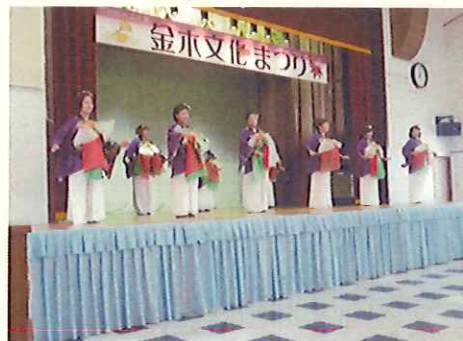
金木文化まつり（金木公民館）