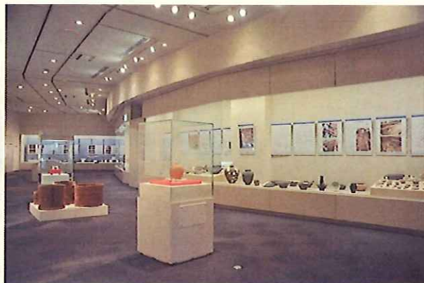
立佞武多の館 美術展示ギャラリー