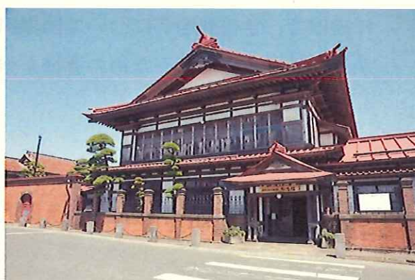
太宰治記念館「斜陽館」