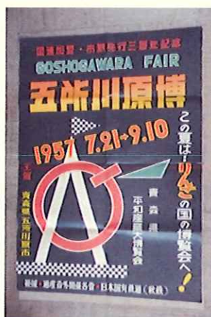
五所川原平和博展開催（図書館）