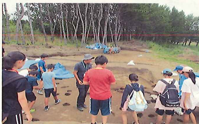
ふるさと再発見 五月女菴遺跡発掘調査説明会

①地域の人材や関係団体・企業等の協力を得ながら、様々な体験を通じて地域の産業や歴史、伝統文化等を学ぶ機会の充実を図り、郷土への愛着と誇りの醸成を図ります。