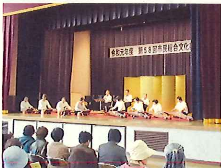
市民総合文化祭（中央公民館）