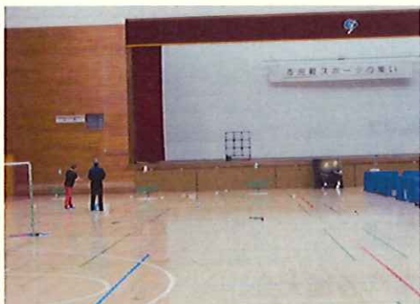
軽スポーツ体験教室