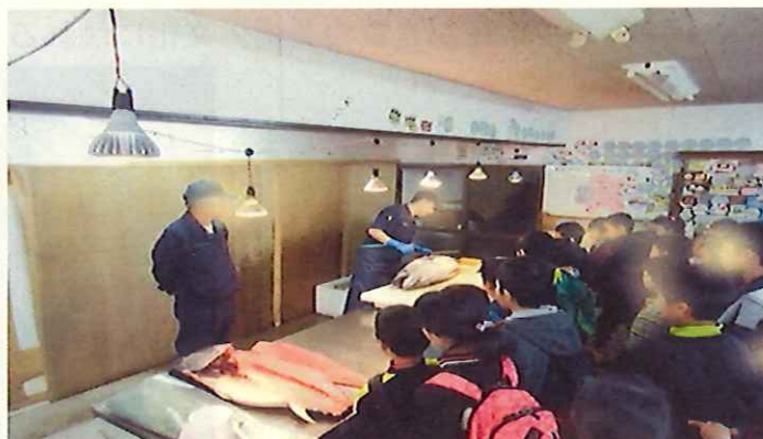
丸中中央水産 施設見学会

②児童生徒が地元企業等の事業所を訪問し、事業内容や働くことの大切さへの理解を深め、自身の将来の就業イメージを持つことができる機会の充実を図ります。