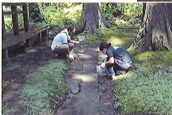
山王坊遺跡の礎石保存処理