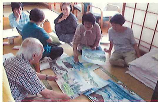
市民教養教室（金木公民館）