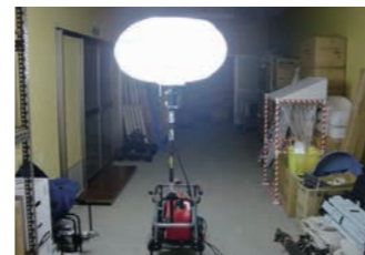
投光器 1基(発電機付)