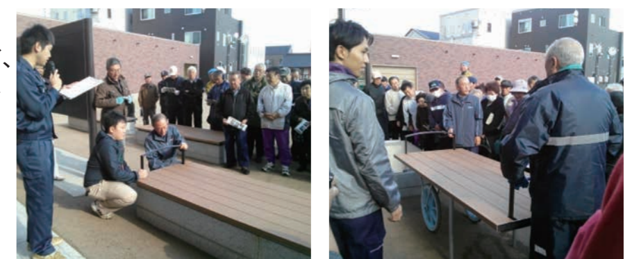
ベンチに収納されるテーブルや大八車を取り出す

公園のベンチの座面の部分を取り外し、自立型テーブルや応急ベッド、大八車として機能し、負傷者や物資等の運搬に活用できます。