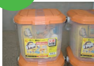
防災用品入りバケツ 12個