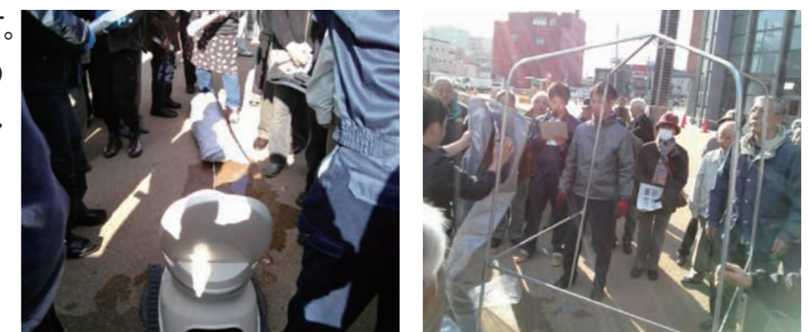
鉄蓋の上に簡易トイレとテントを組み立てる

鉄蓋の下に便槽を設置しています。災害時には、必要に応じて便槽の上に洋便座とテントを設置し利用します。