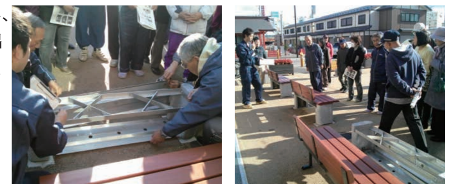
ベンチの中からかまどを組み立て、食事を準備

普段は公園でベンチとして使用し、災害時にはかまどに変身し、炊き出しができます。ベンチの中には、炭置・五徳などが収納されています。