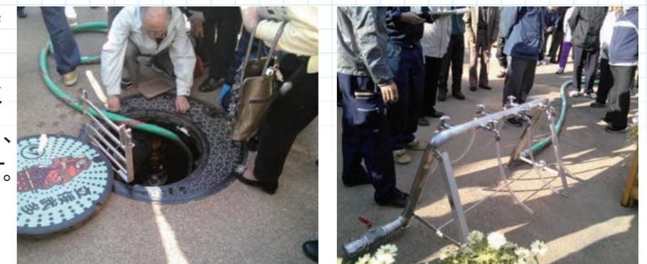
貯水槽のマンホール開け、水を汲み上げ給水口に接続

【注】災害発生時、耐震性貯水槽は市水道課職員が操作しますので、ほかの方は触れないください。