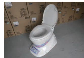
洋式便座 22個(防災トイレ用)