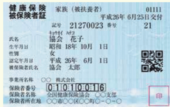
(例)全国健康保険協会(協会けんぽ)特定健康診査受診券