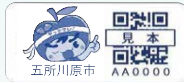
▲おでかけ見守りシール

1人暮らしの方や、ご家族が遠方にいらっしゃる方等、日々の生活で外出等に心配のある方はお気軽にご相談ください。