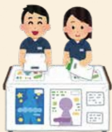
会場準備・片付け