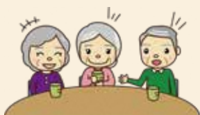
いっしょにおしゃべり