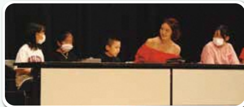
▲令和5年度認知症フォーラムの様子

市では、認知症に関する知識の普及啓発を目的に、市民の方と医療・福祉・介護の関係者が、互いに情報共有し、理解を深める場として、認知症フォーラムを開催しています。今年も素敵なゲストを迎えた企画を準備中ですので、どうぞ期待ください。