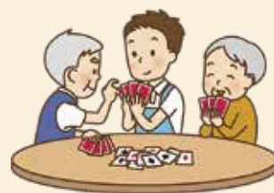
いっしょにトランプ