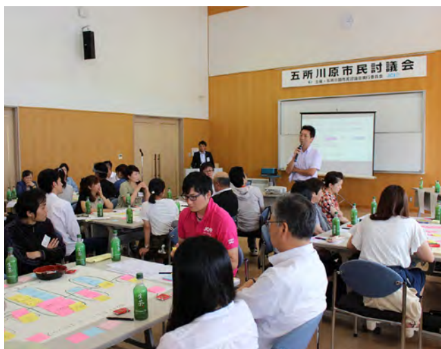
H28年度の市民討議会の様子