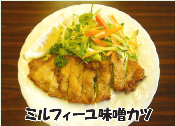
ミルフィーユ味噌カツ