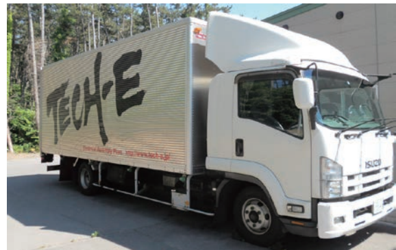
関東へ製品を運ぶ自社トラック