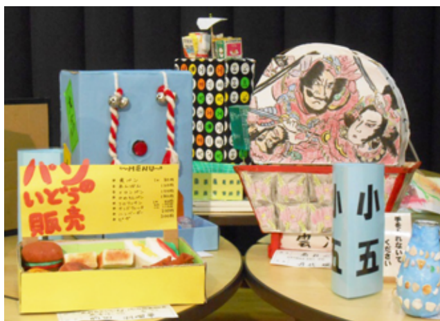
前回の美術展の様子