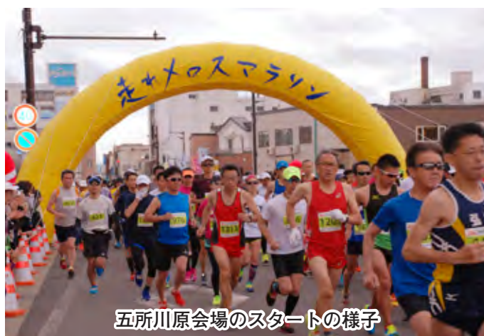
五所川原会場のスタートの様子

また、今年も地元の児童生徒の皆さんやスポーツ団体など約900名の方々が給水等のボランティアとして参加し、走れメロスマラソンを盛り上げました。