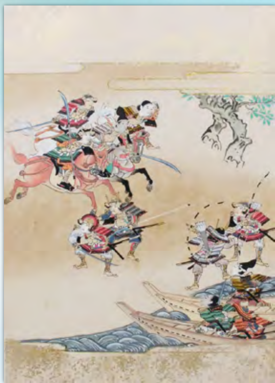
ならえほん 「平家物語」 卷十一 つぎのぶさいご 嗣信最期

開館時間…9:00~17:00 (入館時間16:30まで) 入館料…300円 (団体20名以上、270円) 高校生以下無料