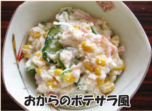
おからのポテサラ風