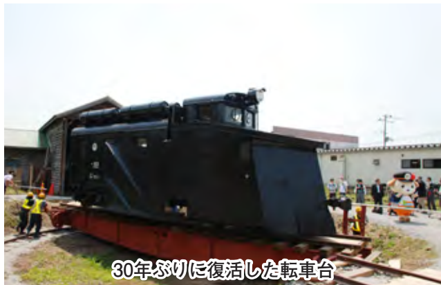
30年ぶりに復活した転車台

5月21日、津軽鉄道(株)が所有する本州最北の転車台が津軽中里駅構内に30年ぶりに復活しました。転車台は、列車を回転させ、進行方向を変える設備であり、昭和初期に作られた大正時代の型で、ラッセル車の利用停止に伴い放置されていました。この度、津軽鉄道サポーターズクラブが地域振興に役立てようとクラウドファンディング（インターネットでの資金調達）を活用し、復元に掛かる整備費を募ったところ、県内外から185万8000円の善意が寄せられました。