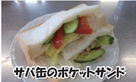
サバ缶のポケットサンド