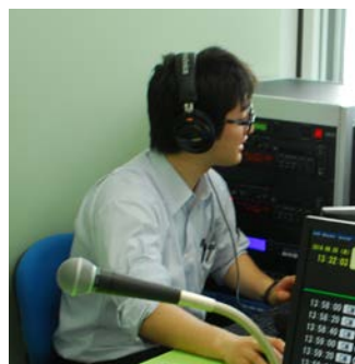
パーソナリティによる放送

7月10日、コミュニティFM局「FMごしょがわら」が放送を開始しました。 FMごしょがわらを利用し、市の情報を「市役所かわら版」として皆さんにお届けします。市役所かわら版では、パーソナリティが広報紙をもとにその内容を伝えるほか、市職員が出演しパーソナリティとの対談形式により、市政情報をよりわかりやすく皆さんにお伝えしていきます。