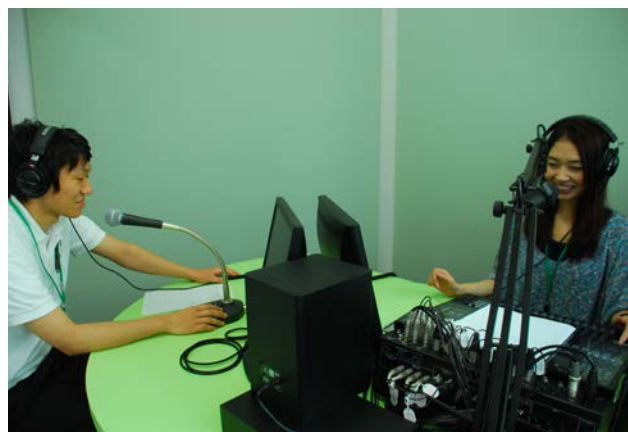
市職員が出演している様子

優先して行うこととしていますので、そういった災害時にはFMごしょがわらの放送に耳を傾けてくださるようお願いいたします。 市からの情報伝達手段を増やし、市民と行政との情報共有と災害に強い安全・安心なまちづくりを図っていきます。