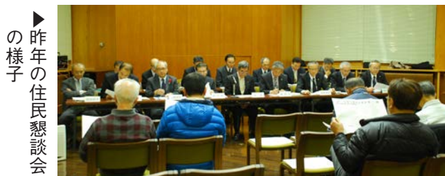
▶ 昨年の住民懇談会の様子