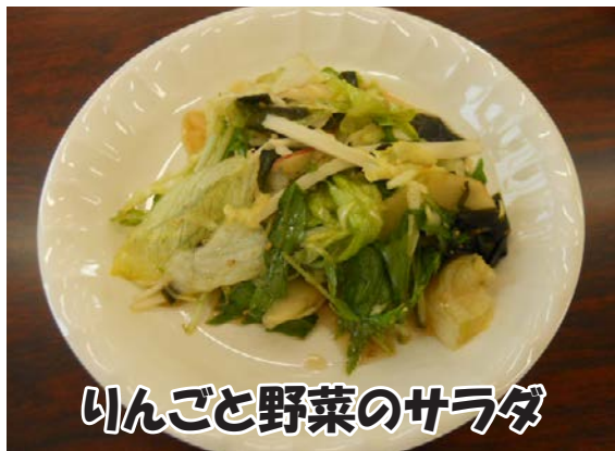
りんごと野菜のサラダ