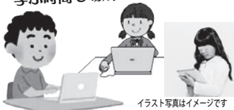
イラスト写真はイメージです