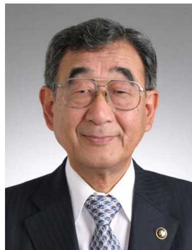
五所川原市長 平山 誠 敏