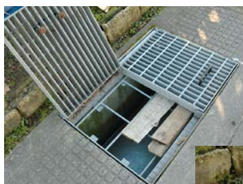
◀ 蓋を開けやすくしようと板を挟むと…