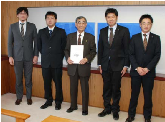
市長へ報告書を提出した青年会議所の皆さん