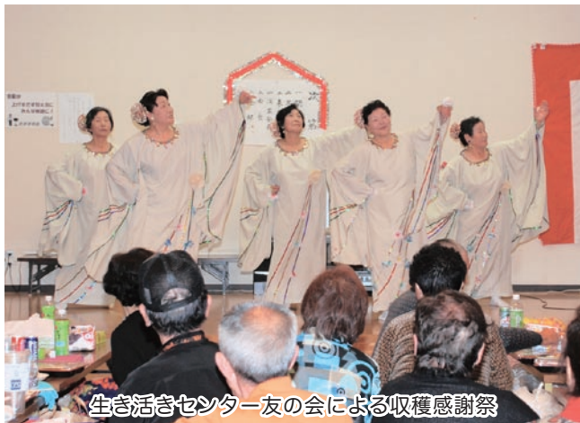
生き生きセンター友の会による収穫感謝祭

11月7日に開催され た収穫感謝祭では、金 木地区からの参加者を 含め約150名が参加 し、食事しながら、利 用者の演芸や作品展示 などで楽しみました。