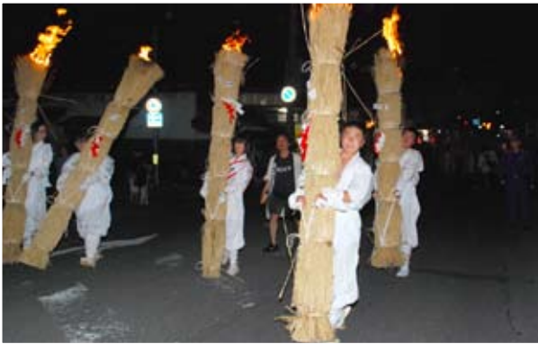
たいまつを抱える親善大使