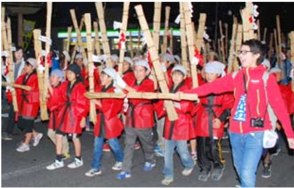
練り歩く子どもたち

五所川原農林高校の生徒の荒馬からスタートし、囃子とともに、けやぐ虫送り愛好会、飯詰虫会の2体の虫が進行。その後ろを大小のたいまつを持った子どもたちが「ヤッサー」の掛け声を上げながら元氣よく進み、沿道の観衆を魅了しました。