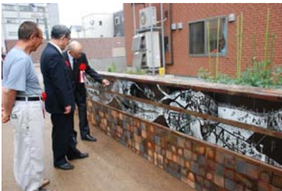
歴史絵巻をぜひご覧ください