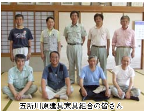
五所川原建具家具組合の皆さん