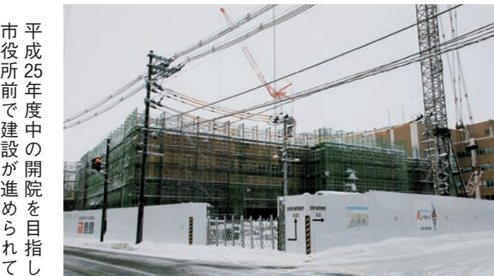
平成25年度中の開院を目指して市役所前で建設が進められている「つがる総合病院」

重要となっており、二元代表制度の一翼を担う議会は、市民のさまざまな意見やニーズを的確に把握し、議会に反映するとともに、市政に対するチェック機能を強化し、市民とともに市民福祉の向上のため、より一層の努力が必要と考えております。 五所川原市におきましては、本年明るい展望が数多くあります。商業の振興に不可欠である「大町区画整理事業の完成」、教育環境の礎となる「中央小学校の新築」、市民の生命と財産を守る「消防庁舎の新築移転」、西北五圏域の医療の中心となる「つがる総合病院の完了」、また地元より需要の強い「金木老人福祉センター（川倉のゆっこ）の改築」、市浦地区での津波に対する「防災対策」等々を予定しており、いずれも市民に安全安心、福祉の向上を約束する施策であり、市民とともに一日も早い実現を心待ちにいたしているものであります。 私も議決機関といたしましては、今後さらに市民の皆様のご提言やご意見を市政に反映し、創意工夫を重ねより住みよいまちづくりを目指し、市民のご期待にこたえるよう議員二十六名、一層研鑽を重ね努力してまいり、決意を新たにしておりますので、