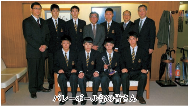
バレーボール部の皆さん