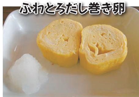
ふわとろだし巻き卵