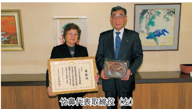
竹鼻代表取締役 (左)