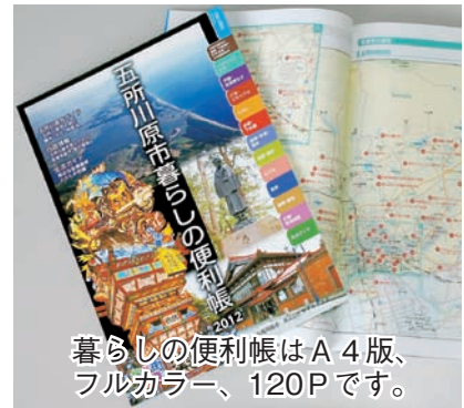
暮らしの便利帳はA4版、フルカラー、120Pです。