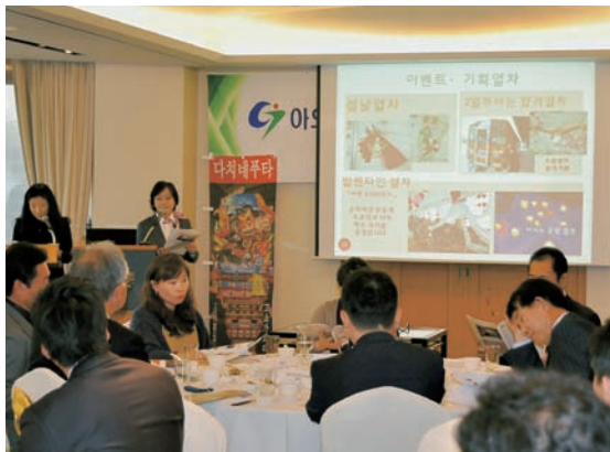
(右)好評だったリンゴジュース試飲 (左)旅行社へ四季を通じた地域の魅力をPR (上)中型立佞武多「剛力項羽」

11月2日から韓国ソウル市で開催されている灯籠祭り、ソウルランタンフェスティバル2012に立佞武多が出陣しました。 この祭りはソウル市の中心部を流れる清溪川(チョンゲチョン)に沿って、約1・5kmにわたり世界中から集まった灯籠が並ぶもので、立佞武多の出陣は3年連続となります。 約3万台の色とりどりの大型灯籠が展示されるなか、高さ6mの中型立佞武多「剛力項羽」は会場を訪れた観客からひと際注目を集めていました。会場では、海外からの観光客誘致活動として、囃子の実演やうちの製作体験、リンゴジュースの試飲や観光パンフレットの配布を行ったほか、韓国の旅行社を招いてプレゼンテーションを行うなど積極的に観光情報をPRしました。 ソウルランタンフェスティバルは、18日まで開催され、「剛力項羽」は世界中の灯籠と一緒に清溪川の水面を照らします。