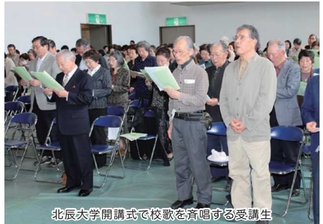
北辰大学開講式で校歌を斉唱する受講生