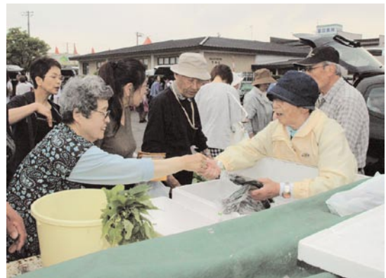
夕市にぜひお越しください