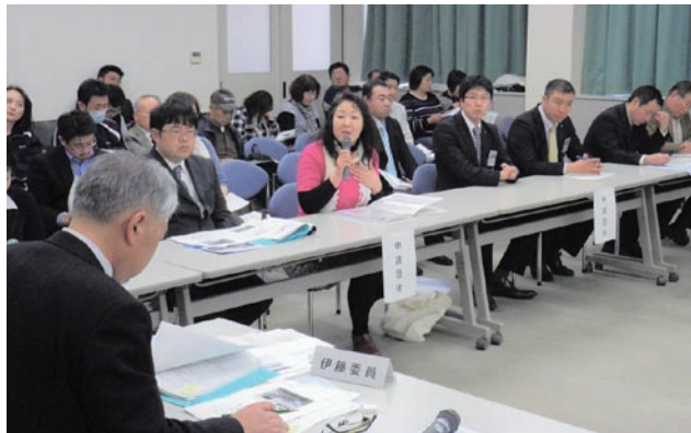
各団体が審査会委員に活動内容を説明し全事業が採択されました