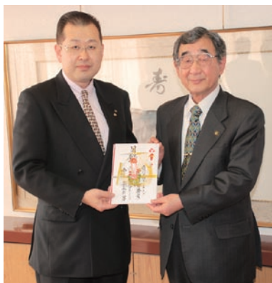
「被災者支援にお役立てください」と花田会長(左)