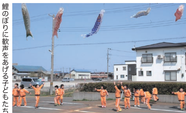
鯉のぼりに歓声をあげる子どもたち