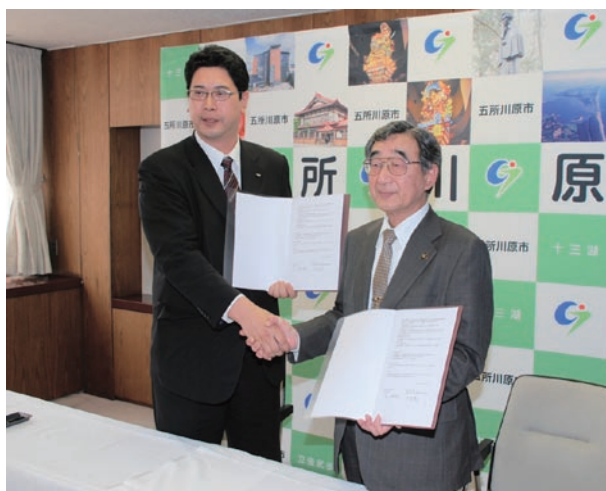
市民討議会開催への協定にサインし、握手する今理事長（左）と市長

種をまき、市民が愛し誇りに思える故郷にしたい」と述べ、協定書にサインし握手を交わしました。