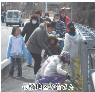
長橋地区の皆さん