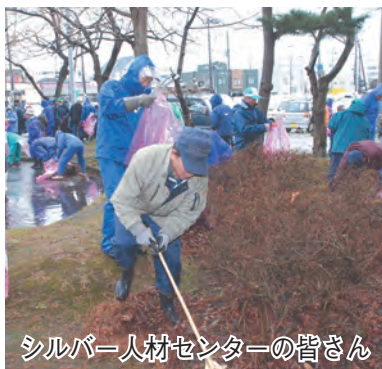
シルバー人材センターの皆さん