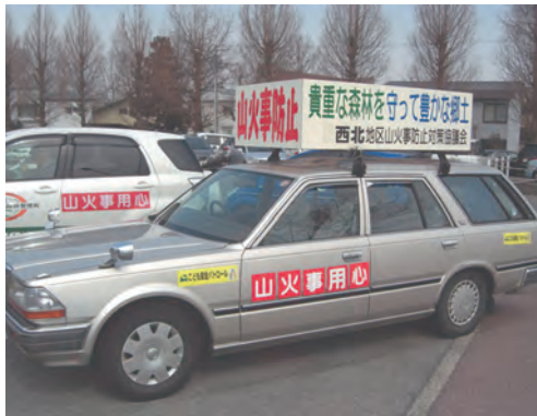
山火事防止宣伝パレードに出発 山火事用心!