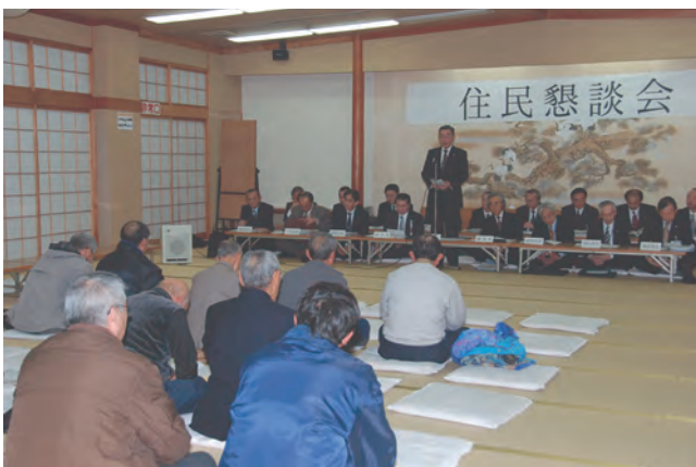
昨年の住民懇談会の模様(金木公民館にて)

◎今後も日程が確定次第、お知らせしていきます。 ◎お問い合わせ先 総務課 内線2117