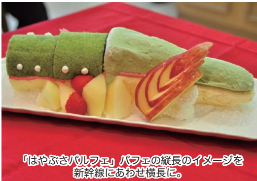
「はやぶさパフエ」パフエの縦長のイメージを新幹線にあわせ横長に。

「青森DC (デスティネーションキャンペーン)」 青森県とJRグループが協力して実施する 日本最大級のキャンペーン