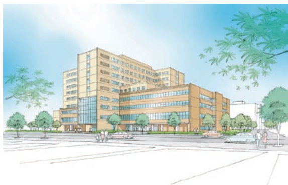
▶つがる総合病院イメージ

*応募や選考結果の詳細はつがる西北五広域連合ホームページ( http://www.aoi-mori.net/~tsugaru/ )をご覧ください。