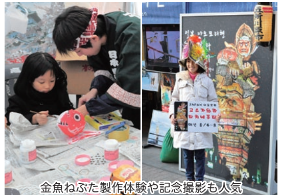
金魚ねぶた製作体験や記念撮影も人気