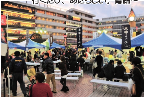
写真：昨年のフェアの様様