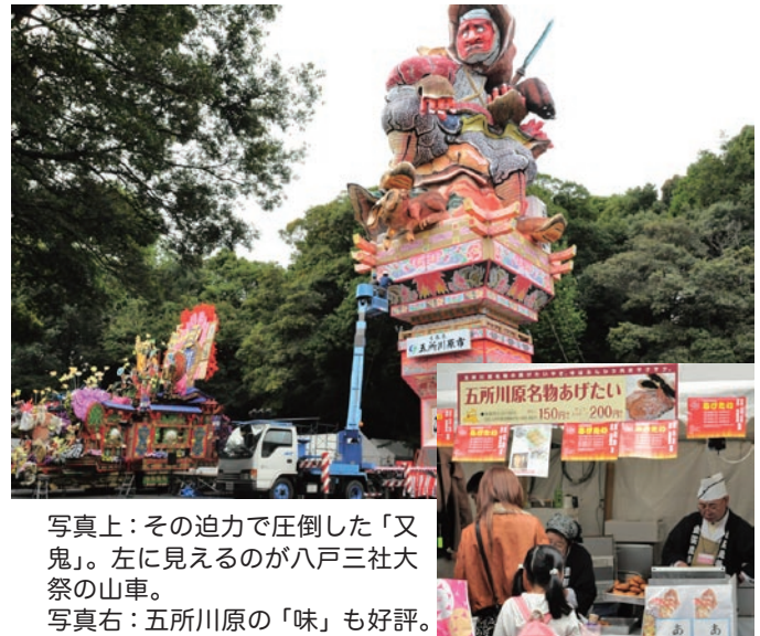
写真上：その迫力で圧倒した「又鬼」。左に見えるのが八戸三社大祭の山車。 写真右：五所川原の「味」も好評。

また、青森ご当地グルメ屋台村には「五所川原名物あげたい」と「十三湖元祖しじみラーメン」が出店し、「味」も好評でした。