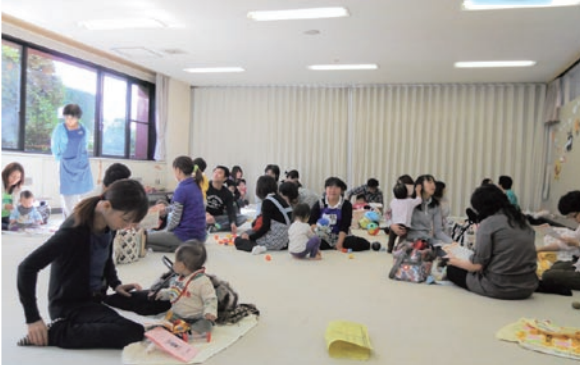
保健センター五所川原でのエンゼル相談(10/14)