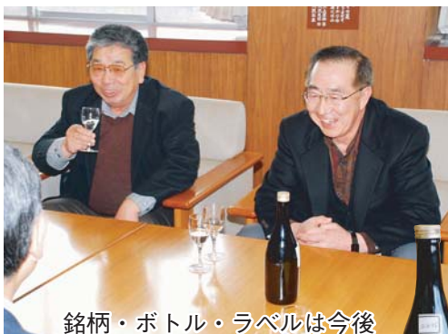
銘柄・ボトル・ラベルは今後募集のうへ決定予定

焼酎を試飲した市長は「口当たりが良く飲みやすい。香りがいい」と高く評価。須崎代表理事と岡田理事は「国内で流通している大豆の焼酎はごくわずか。早く商品化して五所川原ブランドにし、市の名前を全国へ売り込みたい。価格は手ごろな値段段におさえて皆さんに楽しんでもらえるようにしたい」と今後の展望を話していました。