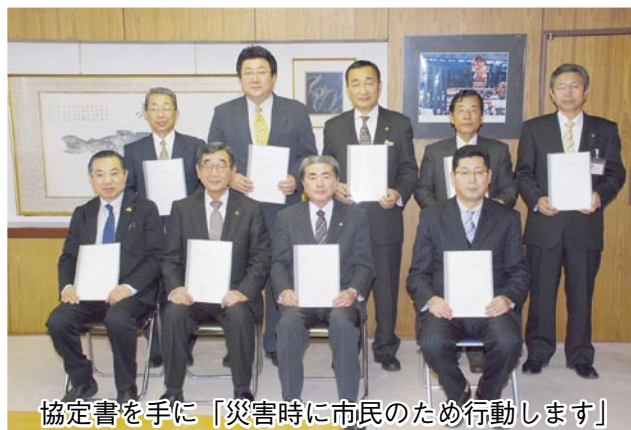
協定書を手「災害時に市民のため行動します」