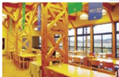
お食事はレストラン『わらび』