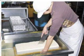
「奴みそ」や「豆乳プリン」「おからドーナツ」も人気