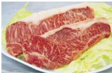
市浦牛やヤマトシジミも味わえます