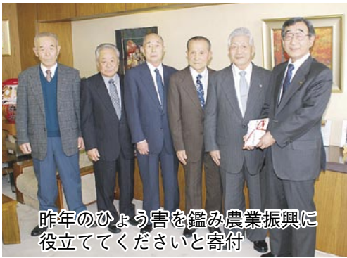
昨年（2008年）のひょう害を鑑み農業振興に役立ててくださいと寄付