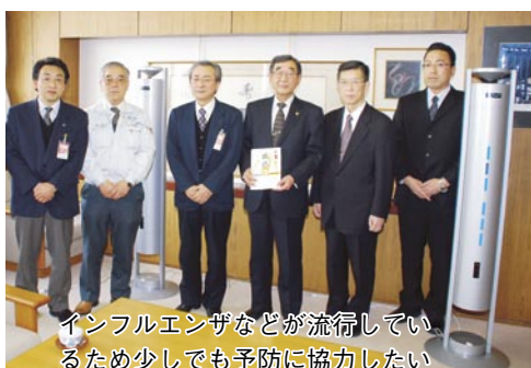
インフルエンザなどが流行しているため少しでも予防に協力したいと話し循環式空気殺菌灯を寄贈