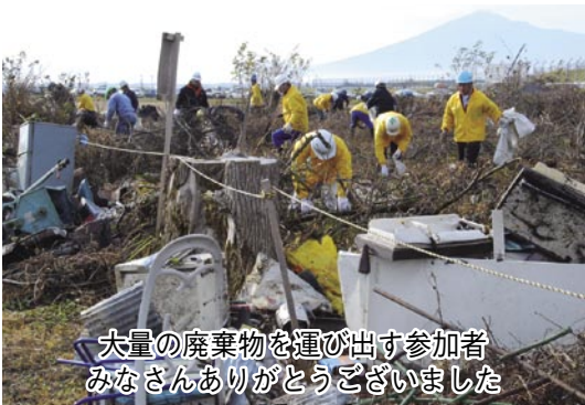
大量の廃棄物を運び出す参加者みなさんありがとうございました