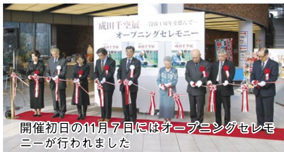
開催初日の11月7日にはオープニングセレモニーが行われました

昨年十一月十七日に八十六歳で逝去された、成田千空（本名・力）氏の没後一周年を偲び、成田千空展が開催されています。千空氏は、俳壇で最も権威のある蛇笏（だこつ）賞を受賞（平成十年）されるなど、青森俳壇の中心的存在として活躍。平成十六年には五所川原市名誉市民章を受章しています。