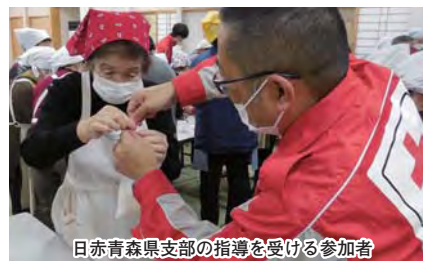
日赤青森県支部の指導を受ける参加者

炊き出しの際のテント設営や三角巾を用いた応急手当を学ぶ包帯法、防災シミュレーションゲームなどを通して、災害時における地域との連携強化を図りました。