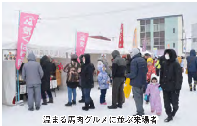
温まる馬肉グルメに並ぶ来場者

また、かつて同地域で大人気イベントだった「人間ばん馬」の体験が行われたほか、ひときわ目を引く巨大な雪の滑り台では、子どもたちから「楽しい!」「速~い!」などの元気な声が響いていました。