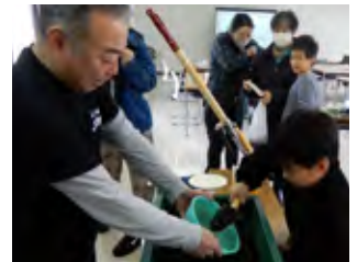
すくいどりに挑戦する参加者