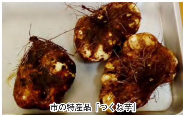
市の特産品「つくね芋」

最大のポイントは市の特産品「つくね芋」です。水分が少なく肉質が締まっており、強い粘りと風味が特徴です。