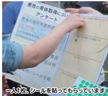
→1枚、シールを貼ってもらっています