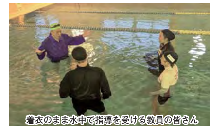
着衣のまま水中で指導を受ける教員の皆さん

水難被災時の対処法等を身をもって経験することで、子どもたちへの危険性の伝達や指導に役立てるため、衣服を着たまま水上で長時間助けを待つ姿勢やペットボトル・レジ袋を活用した救助方法等を指導しました。