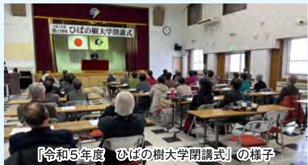
「令和5年度 ひばの樹大学閉講式」の様子

受講生の皆さんそれぞれ充実感と活力に満ち溢れるお顔を拝見して、大変頼もしく感じました。元気な高齢者が増えることは地域にとって大変重要なことです。市としても「健康長寿社会」を目指して、高齢者の交流や社会参加、健康づくりに向けた施策をより一層講じていきたいと思います。