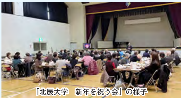
「北辰大学 新年を祝う会」の様子

全国的に人口減少が進む一方、東京一極集中はますます加速し、地方における人口減少がより深刻さを増す中で、人口減少対策や持続可能な地域社会を作っていくためには10年先、20年先を見据えて考えなければなりません。