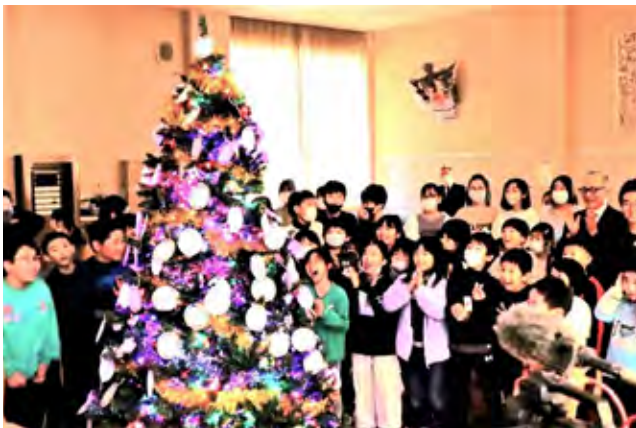
ツリーの点灯を喜ぶ児童たち

元気なカウントダウンの声でツリーが鮮やかに点灯し、児童たちから歓声が上がりました。