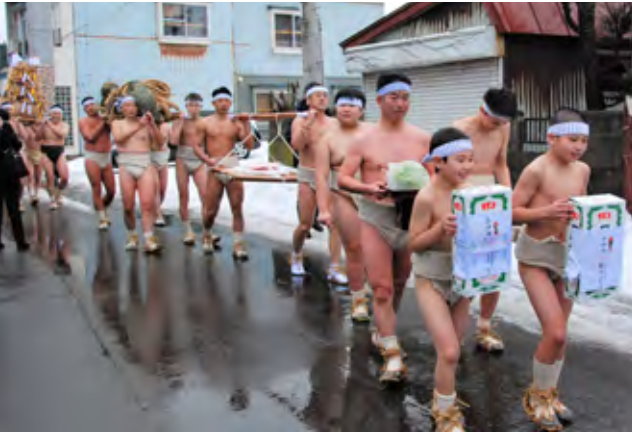
まわし姿で練り歩く参加者

12月31日、無病息災と五穀豊穡を祈願する飯詰稲荷神社裸参りが4年ぶりに開催されました。