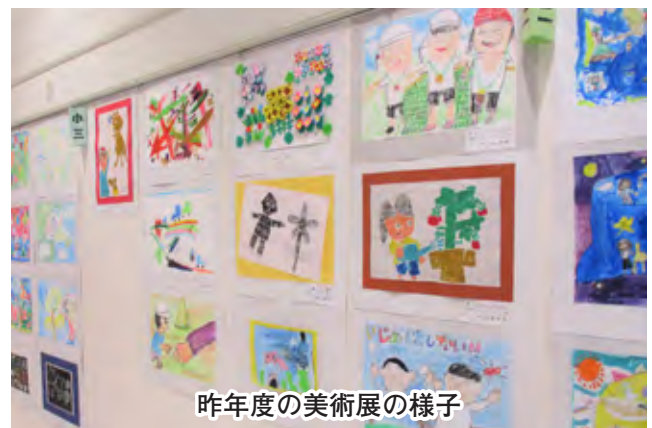
昨年度の美術展の様子