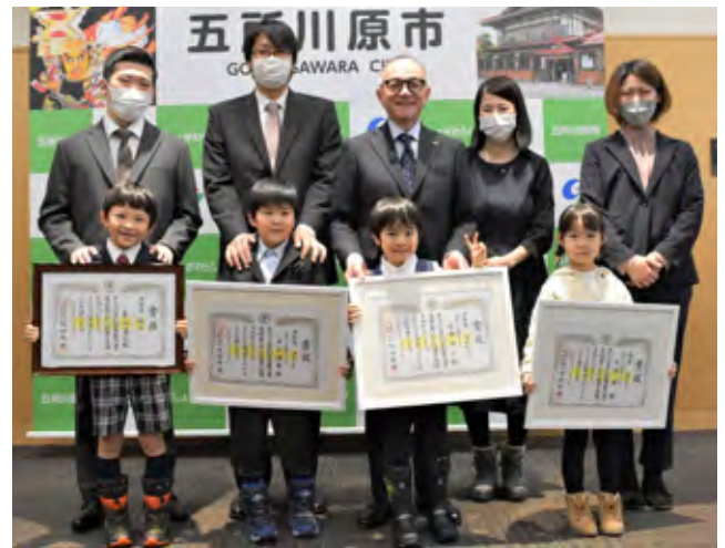
入賞を報告した園児と保護者の皆さん

入賞した園児33名の作品は、1月29日(月)から2月16日(金)まで、市役所1階の土間ホールに展示しますので、ぜひご覧ください。