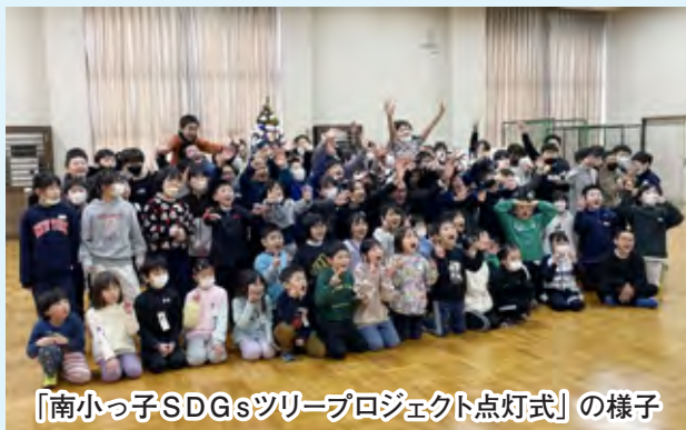
「南小っ子SDGsツリープロジェクト点灯式」の様子

私は、この「南小っ子SDGsツリープロジェクト」の理念や取組を、五所川原から発信し、青森県、全国、そして世界へ広げたいという衝動に駆られました。