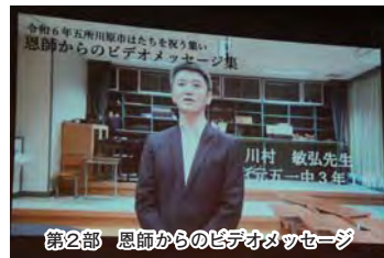
第2部 恩師からのビデオメッセージ

二十歳を迎える方が立派な社会人として飛躍されることを願い「はたちを祝う集い」が1月7日、オルテンシアで行われ、対象者706人中335人が出席しました。