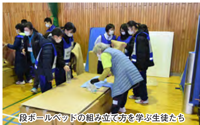
段ボールベッドの組み立て方を学ぶ生徒たち

参加した生徒は「情報を伝わりやすくする工夫を学べた」「災害が発生したら避難者のプライベートに考慮した避難所を協力してつくりたい」と話しました。