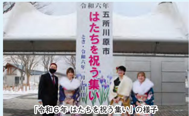
「令和6年はたちを祝う集い」の様子

今年は雪不足のため、メインアクティビティのすべり台の出来具合など不安はありますが、金木商工会を中心に構成された「かなぎまちなかフェスティバル実行委員会」や金木総合支所など官民が一丸となって、ご来場の皆さんに喜んでいただけるよう意気込んでいますので、ぜひ多くの方々のご来場をお待ちしております。