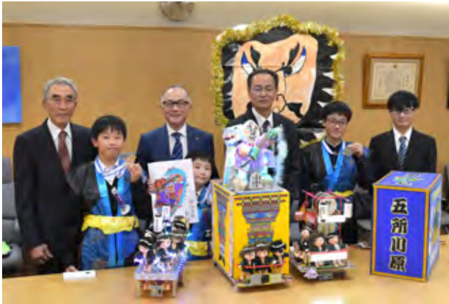
チーム「愉快拿佞武多之會」の皆さん

同コンテストは、青少年の問題解決力やチャレンジ精神の育成等を目的に開催され、全国大会は11月25日に行われました。2～3人でチームとなり、制限時間内に決められたエリア内でからくり機構を使ったパフォーマンスを行い、点数を競い合います。