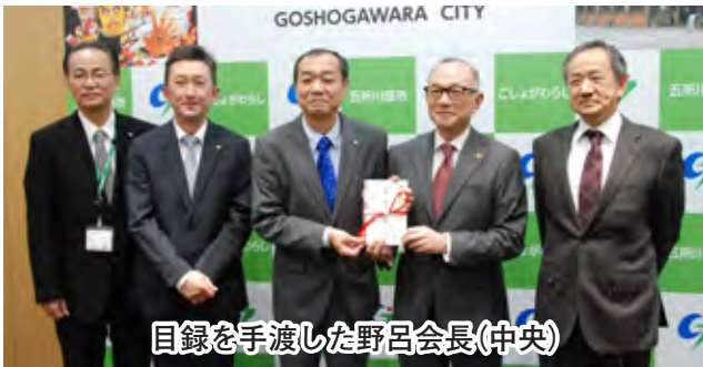
目録を手渡した野呂会長(中央)