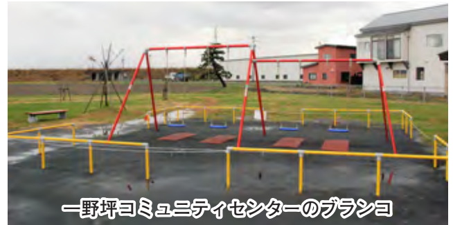
一野坪コミュニティセンターのプランコ