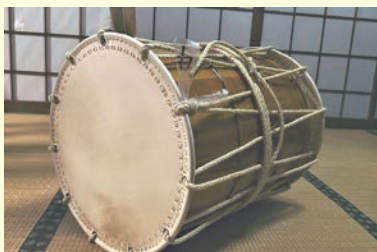
登山囃子太鼓ほか