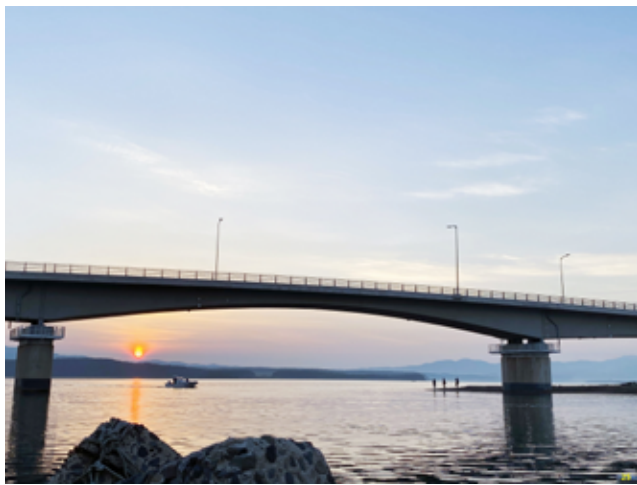
相川さんの作品「十三の朝日と十三大橋」(男湯)