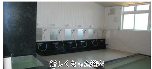
新しくなった浴室

新しくなった「川倉の湯っこ」は、以前より浴槽は広く、カランの数も倍となりました。また、浴場と脱衣所を床暖房とし、温度差を小さくして健康に配慮しています。「金木中央老人福祉センター」は大広間の畳を新しいものに替え、新鮮な香り漂うスペースとなりました。皆様のご利用をお待ちしています。