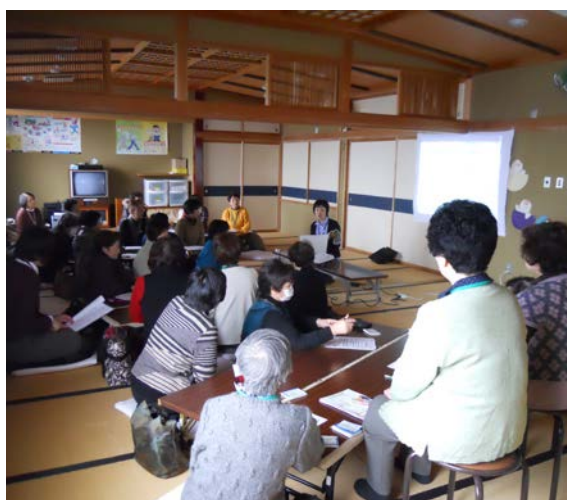
地区懇談会で学ぶ保健協力員

減塩の工夫として、霧吹きしょう油をおかずの表面に振りかける、みそ汁は具だくさんにする、野菜を多く食べる、牛乳を使用して調理する、調味料を計量スプーン等で測る事等が自分達ができる事だと思いました。特に、霧吹きしょう油は簡単に実行できますのでお試しください。また、自宅での血圧測定を行う事も大切です。血圧のタイプは4種類あり、夜間や朝方に高くなるタイプがあるので、朝、晩1日2回の測定をお勧めします。