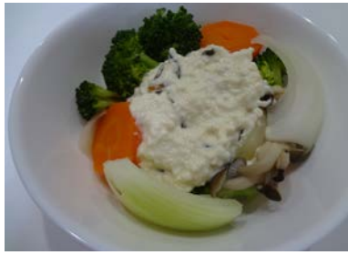
塩昆布ソースの 温野菜サラダ