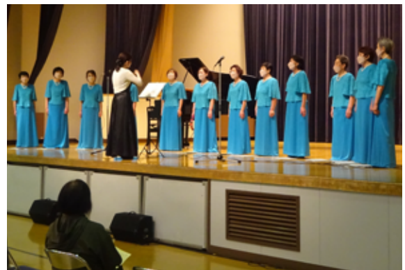
コ ー ラ ス