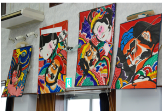
津 軽 凧