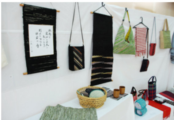
さ ぎ 織 り